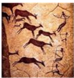
Pintura Rupestre (Cueva de Altamira- España)