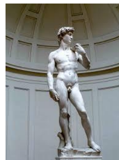
EL DAVID. MIGUEL ÁNGEL. Mármol de Carrara. 5,17 mt. Galería de la Academia- Florencia -Italia

La escultura (del latín sculpere, esculpir) es una forma de expresión artística consistente en tallar,