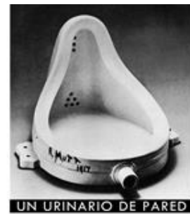
UN URINARIO DE PARED ¿ESTO ES ARTE?