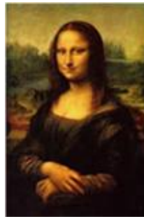
La Gioconda. Leonardo Da Vinci. Pintura al óleo sobre tabla de álamo 1503 - 1515(Museo del Louvre -París-Francia)