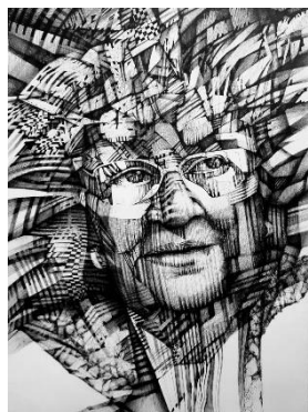
Snovi - Juan Vladimir Martinovich-2019-Papel 30 x 45 cm

La obra de Juan Vladimir Martinovich es, en última instancia, un diálogo íntimo entre el pasado y el presente, entre la luz que ilumina los recuerdos y la sombra que los custodia. Es un arte que no solo se contempla, sino que se siente, un arte donde cada línea, cada color, cada figura, revela la profundidad de un alma conectada con su historia, su tierra y sus emociones.